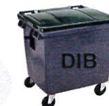
BAC ROULANT Individuel IDENTIFIE DIB

Les autres Déchets (Cagettes cassées, emballages plastiques, liens , cerclages, cartons souillés, polystyrène) dans les Bacs roulants DIB