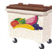
BAC ROULANT Individuel IDENTIFIE BIODECHETS

Les fruits et légumes UNIQUEMENT sont conditionnés dans le compacteur